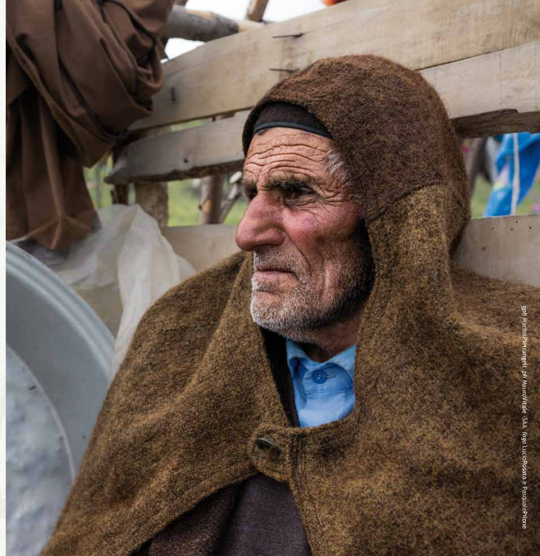
gph MarinaPietrangeli - ph MauroVitale - SAA logo LucioRosato e PasqualePitone